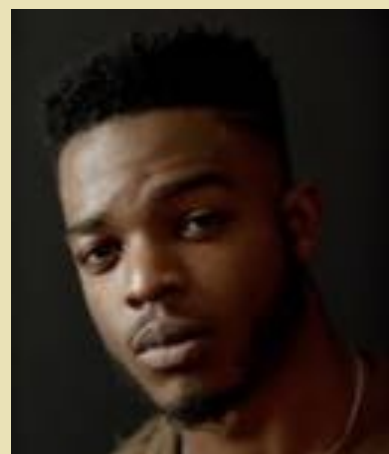
Stephan James Terre d'exil, Selma, Si Beale Street pouvait parler, #freerayshawn, Homecoming