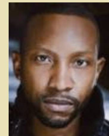
KC Collins Guns, The Stain, RoboCop, Lost Girls, Shoot the Messenger, Rançon