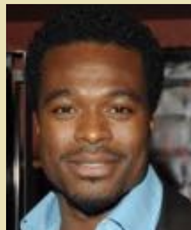
Lyriq Bent Guns, The Affair, Saisir la vie par les cheveux, She's Gotta Have It, Aminata