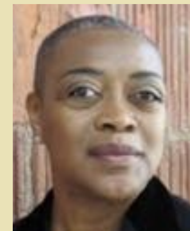
Karen Robinson Rude, Bienvenue à Schitt's Creek, Shoot the Messenger, La Servante écarlate