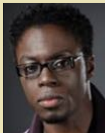
Clé Bennett Doomstown, Man in the High Castle, The Tick, Homeland, Flashpoint