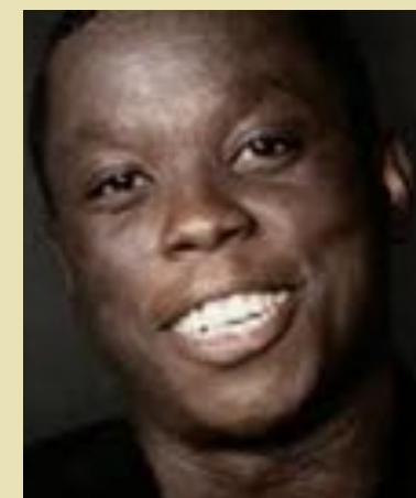
Mpho Koaho Doomstown, MetaJets, Falling Sky, Expanse, Diggstown