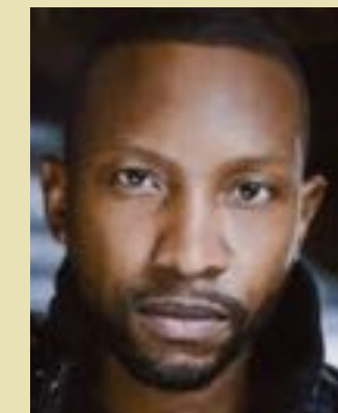
KC Collins Guns, The Stain, RoboCop, Lost Girls, Shoot the Messenger, Rançon